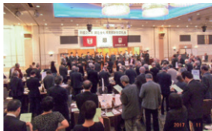
若人と一緒に歌いましょう